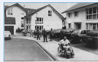
Behinderten-Wohnstätte Kutschfahrt zur Einweihung Neues Haus der Lebenshilfe an der Reinickendorfer Straße