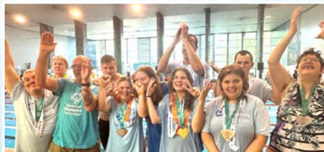
So sehen glückliche Sieger aus!

Am 13. und 14. September 2025 war es wieder so weit: Die Schwimmgruppe der Lebenshilfe Leverkusen nahm am SONRW Schwimm-Fest von Special Olympics NRW im Frankenbad Bonn teil. Zwei Tage lang standen Begeisterung, Teamgeist und sportliche Höchstleistungen im Mittelpunkt.