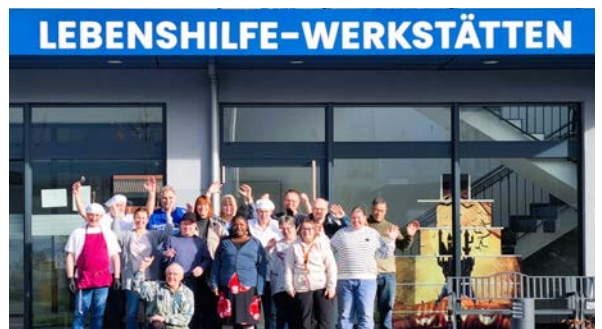
Auch in Opladen nach außen hin jetzt gut sichtbar.