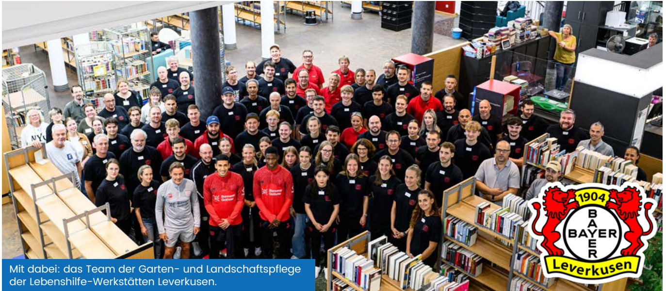
Mit dabei: das Team der Garten- und Landschaftspflege der Lebenshilfe-Werkstätten Leverkusen.

Am 7. Oktober 2025 war es wieder so weit: Beim Aktionstag „Bayer 04-HILFT“ engagierten sich zahlreiche Freiwillige für ein besonderes Projekt – die Neugestaltung der Stadtbibliothek Leverkusen.