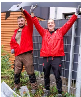
Zusammen etwas zu schaffen macht Spaß!

Doch nicht nur drinnen wurde gearbeitet: Auch draußen war das Garten-Team der Lebenshilfe-Werkstätten mit vollem Einsatz dabei. Die Gärtner gestalteten Beete und Pflanzentöpfe um, errichteten Hochbeete und montierten neue Sichtschutzelemente.