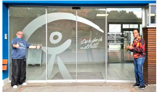
Der neue und moderne Eingangsbereich in Bürrig